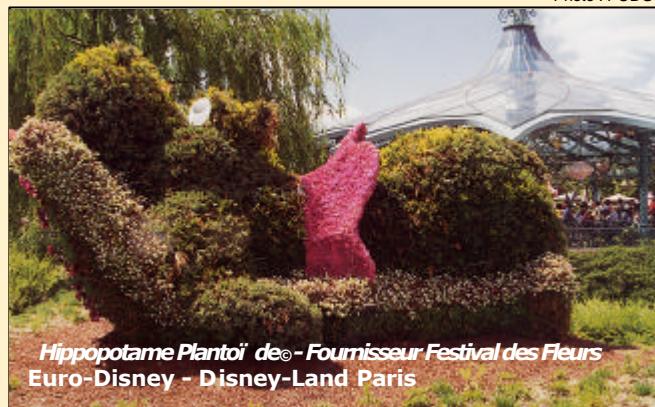
Hippopotame Plantoï de® - Fournisseur Festival des Fleurs Euro-Disney - Disney-Land Paris