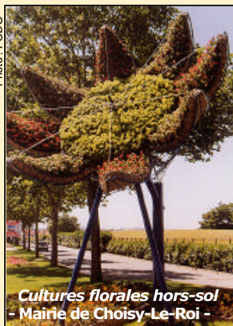
Cultures florales hors-sol - Mairie de Choisy-Le-Roi -