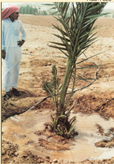
- Moyen Orient - Plantation de Palmiers dattier

L'efficacité de Polyter est reconnue aujourd'hui dans de multiples domaines de la production végétale au niveau mondial.