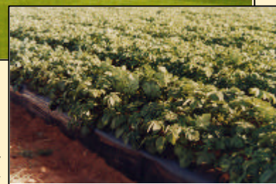
- Maroc - Cultures irriguées de Pommes de Terre à haut rendement