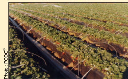
- Maroc - Production de Fraises