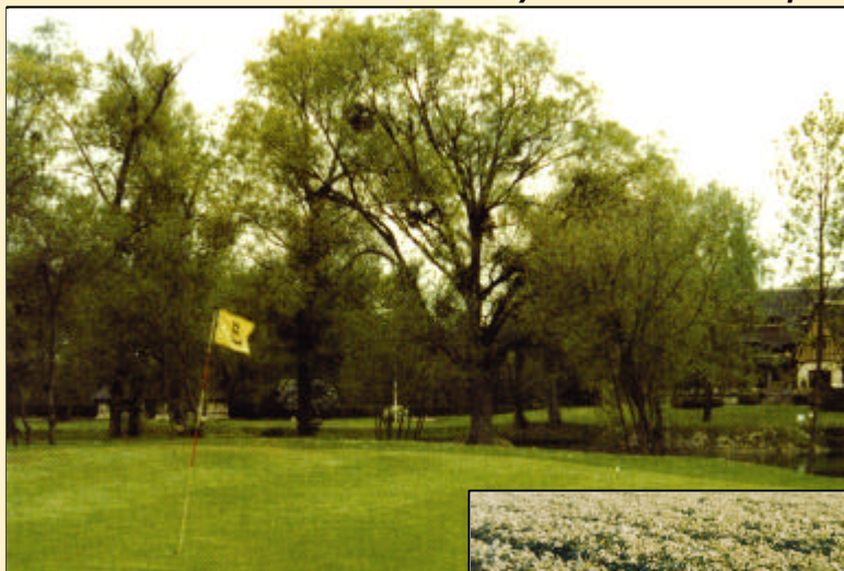
- France - Traitement Polyter sur Terrain de sport

Polyter est un Hydro-Rétenteur Fertilisant doté d'une très grande capacité d'optimisation des besoins et du développement du végétal. La membrane polymérique de Polyter semi-perméable, permet une très rapide absorption des liquides libérés lentement en de très petites quantités en fonction des paramètres locaux (température, évaporation et type de végétal). Par un mode opératoire d'encapsulation, spécifique à Polyter , un équilibre fertilisant (NPK) et des oligo-éléments (Bo Cu Fe Mn Mb Zn) sont incorporés dans les chambres polymériques.