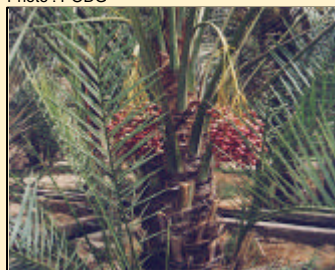
- Emirats Arabes Unis - Palmier dattier